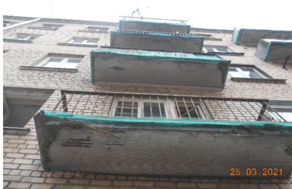
Att.Nr.4. apakšskats uz ēkas balkoniem