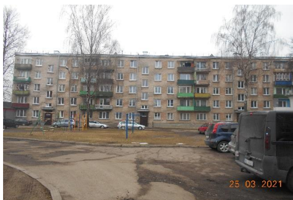
Att.Nr.3. ēkas fasāde no pagalma puses