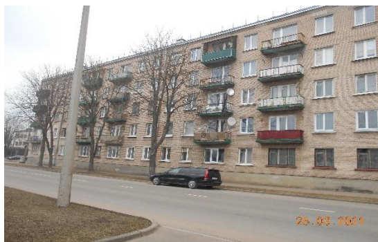
Att.Nr.2. ēkas fasāde no Dobeles ielas puses